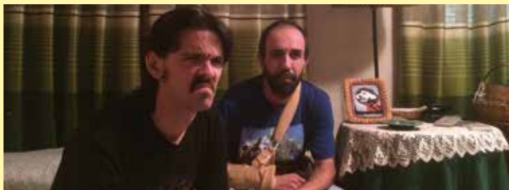
MERMELADA (Lleida). Curtmetratge

Un grup d'homes es reuneix amb estranys propòsits a la Barcelona de 1896.