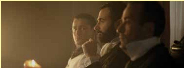
GENTLEMEN (Sant Vincenç de Castellet/Barcelona). Curtmetratge