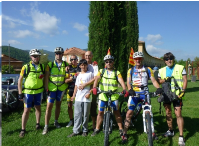
Coll d'Ares i Sant Joan de les Abadesses