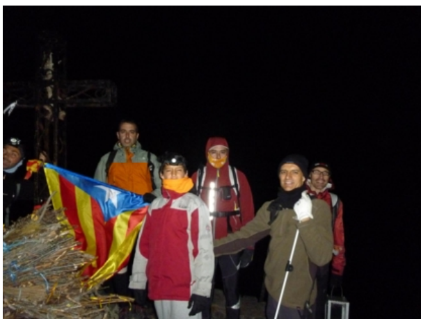
Cim del Canigó