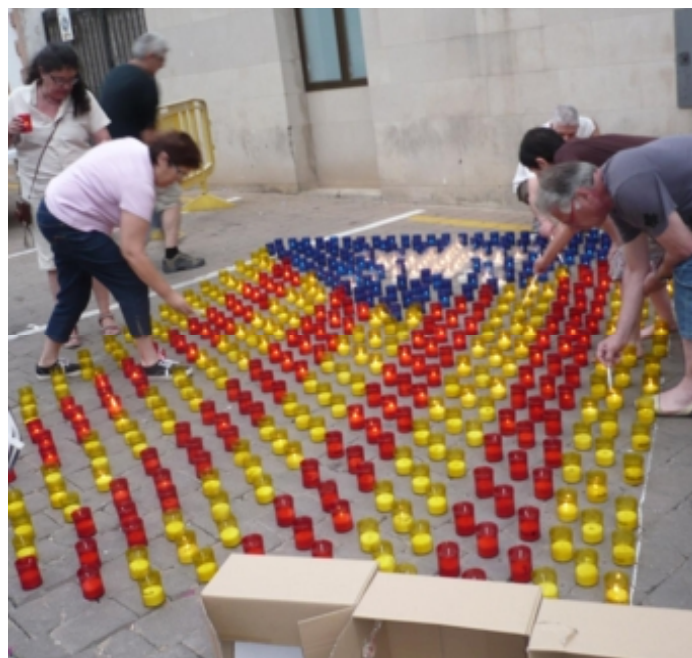
Encesa de l'estelada de colors