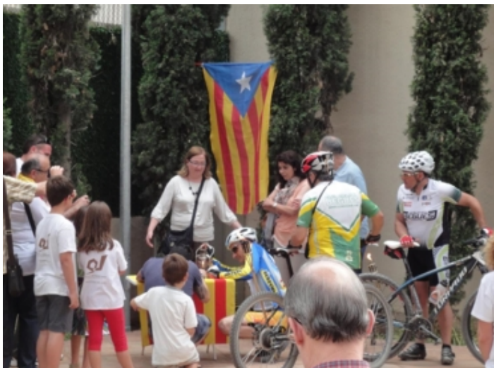
Lliurament a Sant Vicenç dels Horts amb Begues