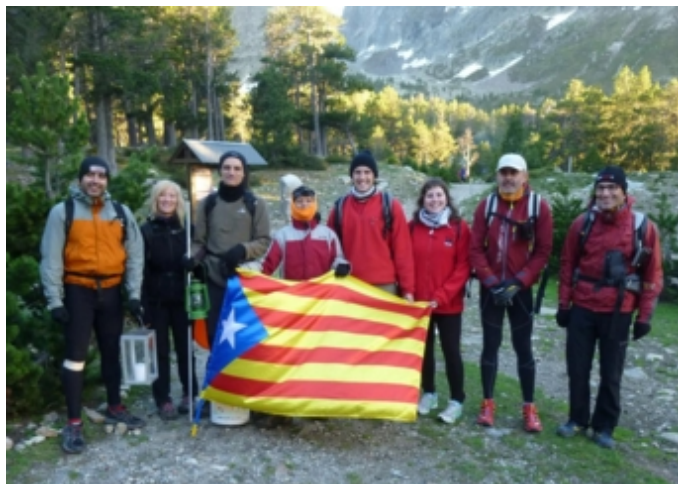
L'equip del Cim, Castellbisbal i Sant Climent