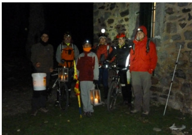
Tornada al refugi, comença la ciclabilitat

Després de sopar vam iniciar la pujada al cim. Per a ells era la primera vegada i van gaudir molt del moment.