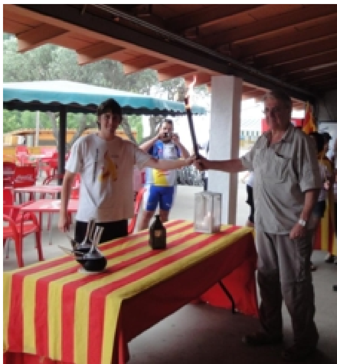
Lliurament a Caldes de Montbui

Anàvem passant pobles com Ripoll, Torelló, Manlleu, Vic, Tona, Centelles fins a Sant Feliu de Codines on es van unir els de Gavà. Plegats vam anar cap a Caldes de Montbui on vam fer el lliurament i vam dinar.