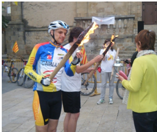
Lliurament a Sant Boi

Després de dinar tocava anar a corre-cuita per arribar a temps a tots els lliuraments que teníem previstos, érem molts més ciclistes i havíem de passar per pobles amb molt de trànsit.