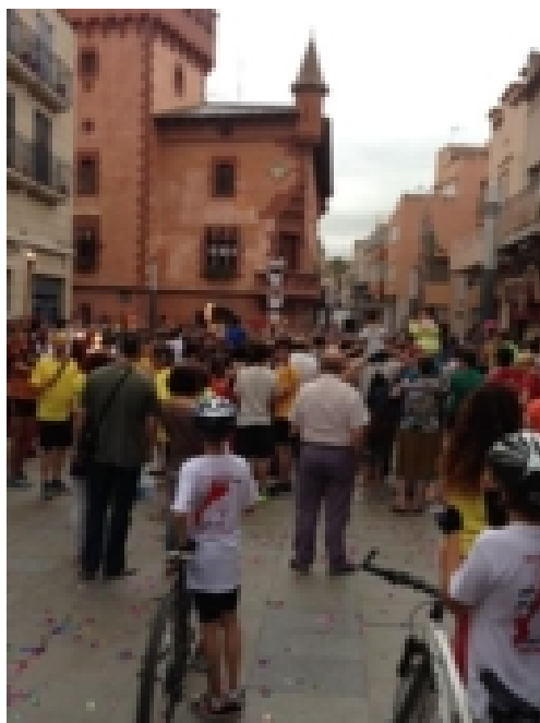
Lliurament a Viladecans

Després de dinar tocava anar a corre-cuita per arribar a temps a tots els lliuraments que teníem previstos, érem molts més ciclistes i havíem de passar per pobles amb molt de trànsit.