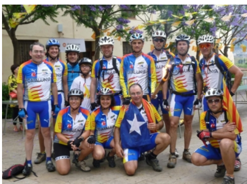
Ciclistes de Gavà i Sant Climent