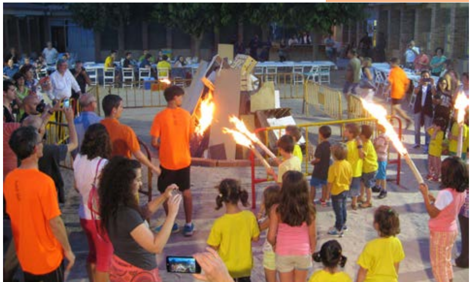
Òmnium va organitzar la portada de la Flama des del cim del Canigó fins a Sant Quintí, amb la col·laboració de l'ajuntament i voluntaris.

Campanya "Un país normal" a l'Associació de Veïns de les Cloïtes.