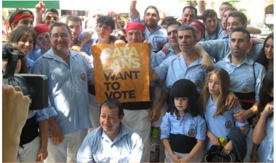
La Colla Jove de Vilafranca va fer castells a Sant Pau d'Ordal per reivindicar el dret dels catalans a votar. Els Xicots de Vilafranca ho van fer a Sant Sadurní i els Castellers de Vilafranca a Brusel·les, mentre els Vailets de Gelida ho feien a la seva plaça.