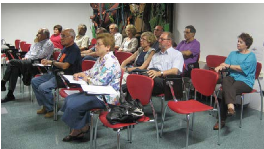
El curs d'història analitza la transició a Catalunya i al Penedès