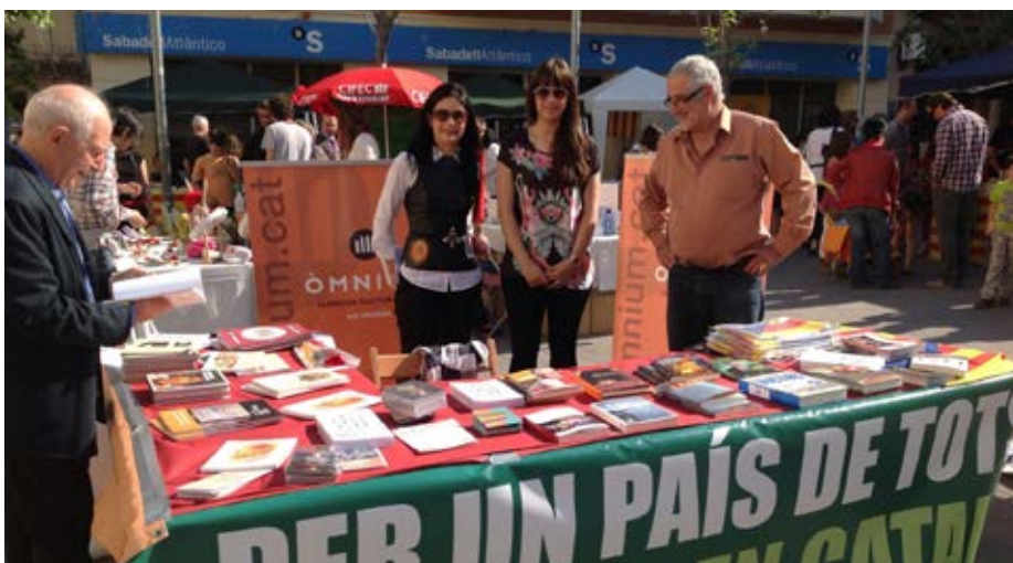
Un Sant Jordi amb més presència al carrer. Punt d'informació i venda de llibres a Sant Sadurní d'Anoia.