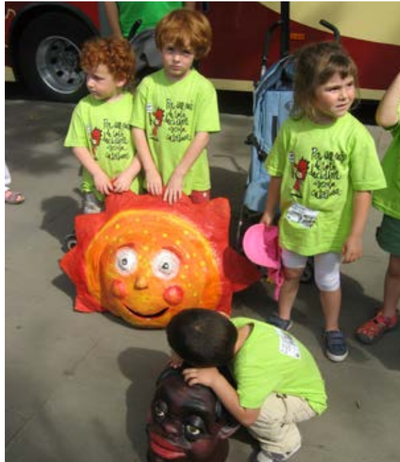
Òmnium Alt Penedès es va sumar a la cercavila "Per un país de tots, decidim escola catalana", organitzant un autocar des de Vilafranca.