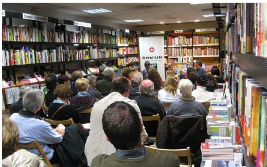
La llibreria l'Odissea plena durant la presentació de "El dia que Catalunya va dir prou"

Parades d'Òmnium a Sant Sadurní i Vilafranca, amb estrena d'un envelat i la col·laboració de diversos voluntaris.