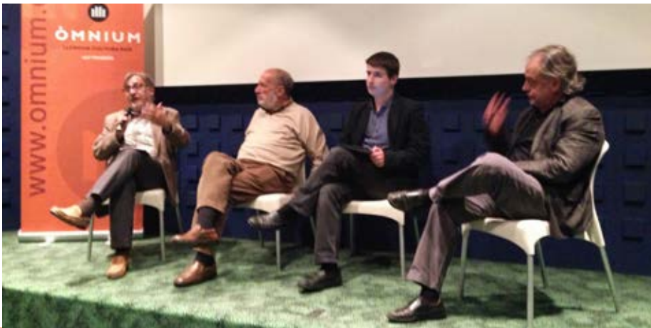
“Coronel Macià” tancava la primera temporada de cinefòrums, una col·laboració d’Òmniium Alt Penedès amb el Cine Club Vilafranca i la Societat “la Principal”, el Casal.