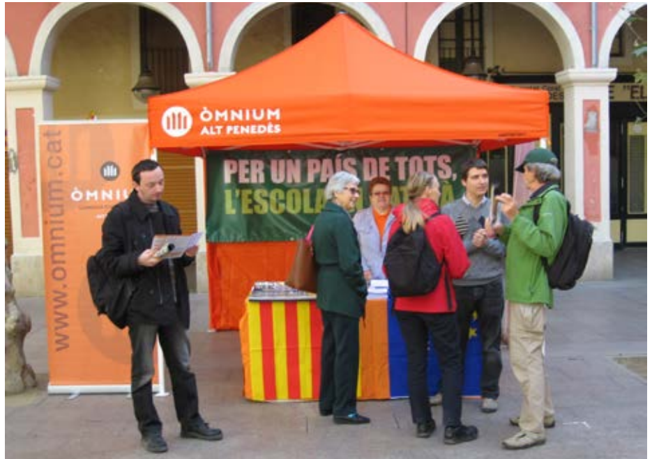
L'envelat d'Òmnium a la diada castellera de Tots Sants

Inici del curs de nivell D de llengua catalana.