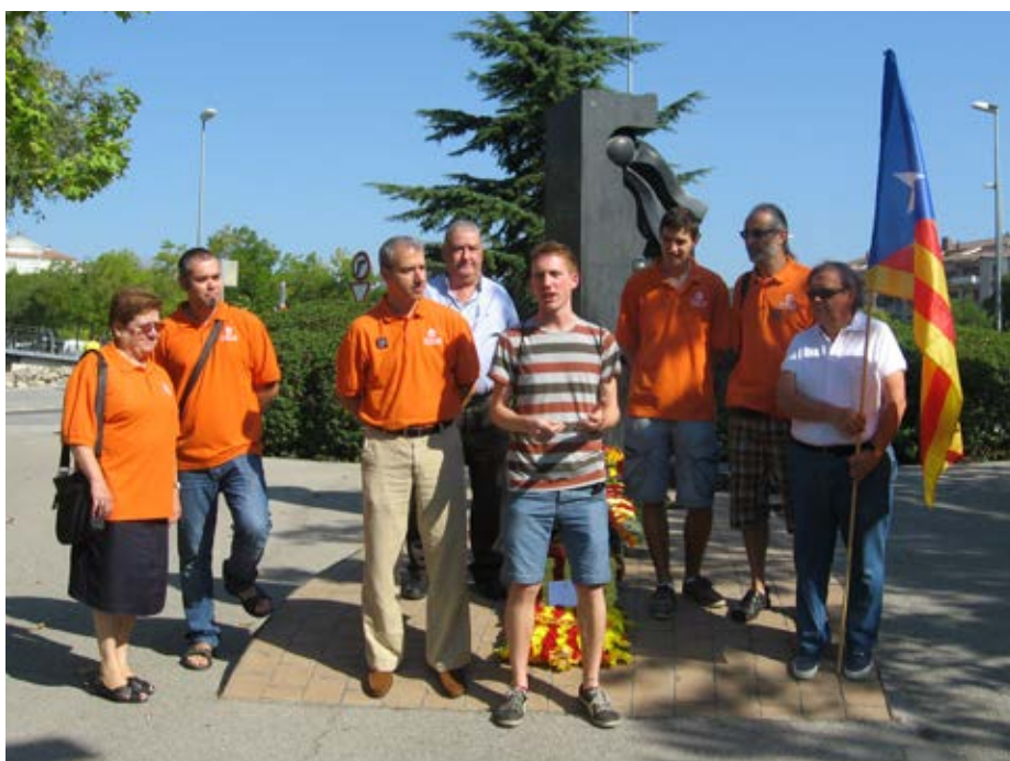
La junta d'Òmnium durant l'ofrena floral de la Diada