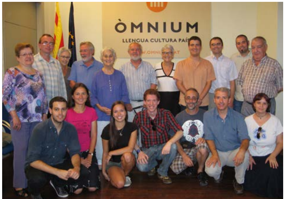
Amb els visitants txecs a la seu d'Òmniium a Barcelona, i a la Via Catalana a Avinyonet del Penedès