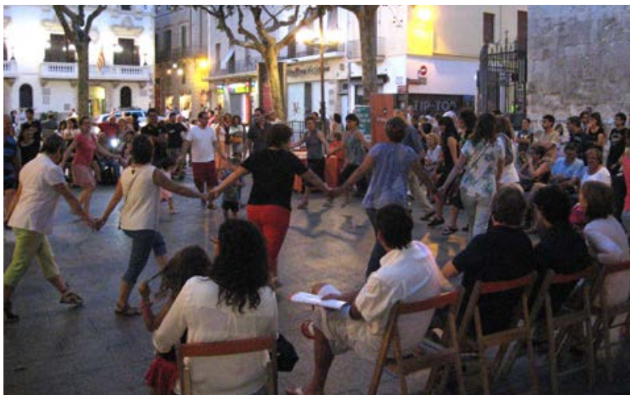
La ballada al carrer aquest any es va fer en dissabte